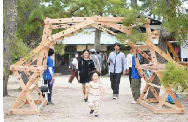
PEN CREATOR AWARDS 2023 受賞