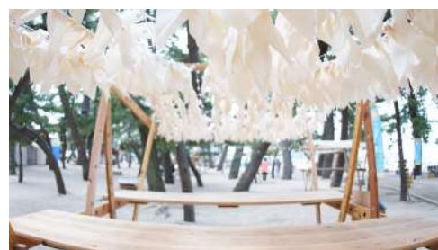
うみぞら映画祭 @淡路島 2023