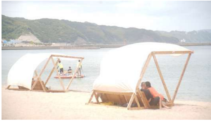
ふるさとイベント大賞2023 年内閣総理大臣賞 受賞