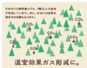
温室効果ガスの削減

森林を持続的に生かしていく取り組み例として 伐倒～製材～加工～利用までをデザインしていく