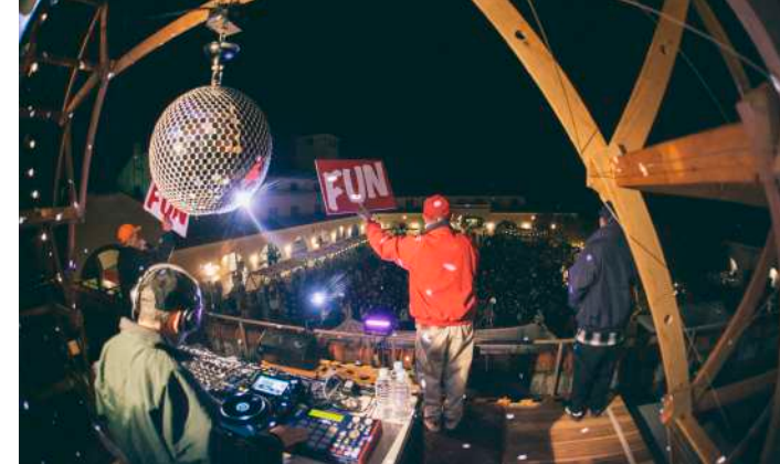
POTENTIAL @淡路島 2023