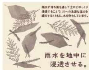
水資源の貯蓄・浄水