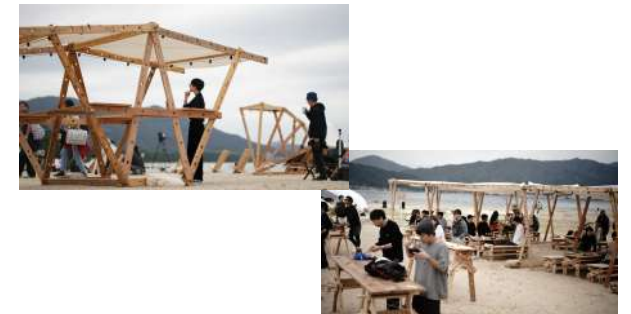
KYOTOPHONIE @天橋立 2023